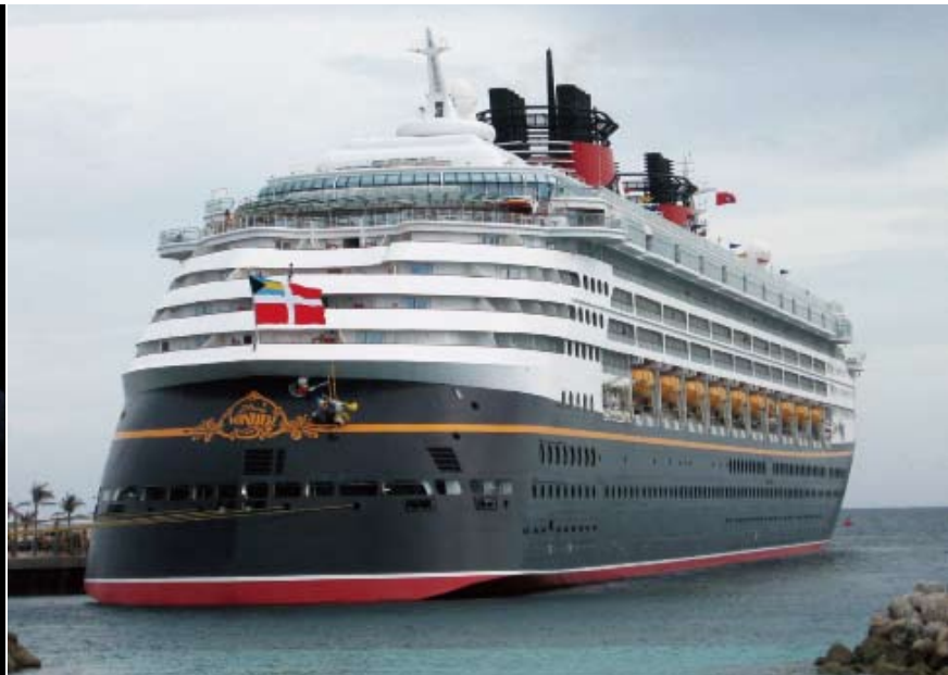
老国王 左图为迈克尔·艾斯纳，从1984年到2005年，他一直担任迪士尼CEO，此间迪士尼收入从10.5亿美元增长到300亿美元。迪士尼现在在全球运营5个度假村、11个主题乐园，1998年启动“迪士尼海上航线”，有两艘巨型邮轮，右图为其中一艘。